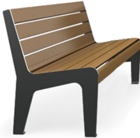
2- Banco para Área Externa - Tipo: Banco Arco - 180x57x68cm